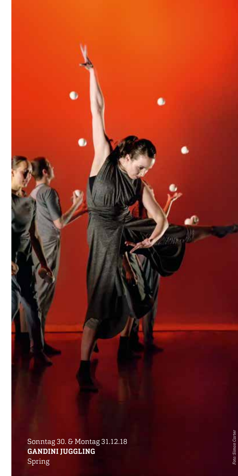
Sonntag 30. & Montag 31.12.18 GANDINI JUGGLING Spring