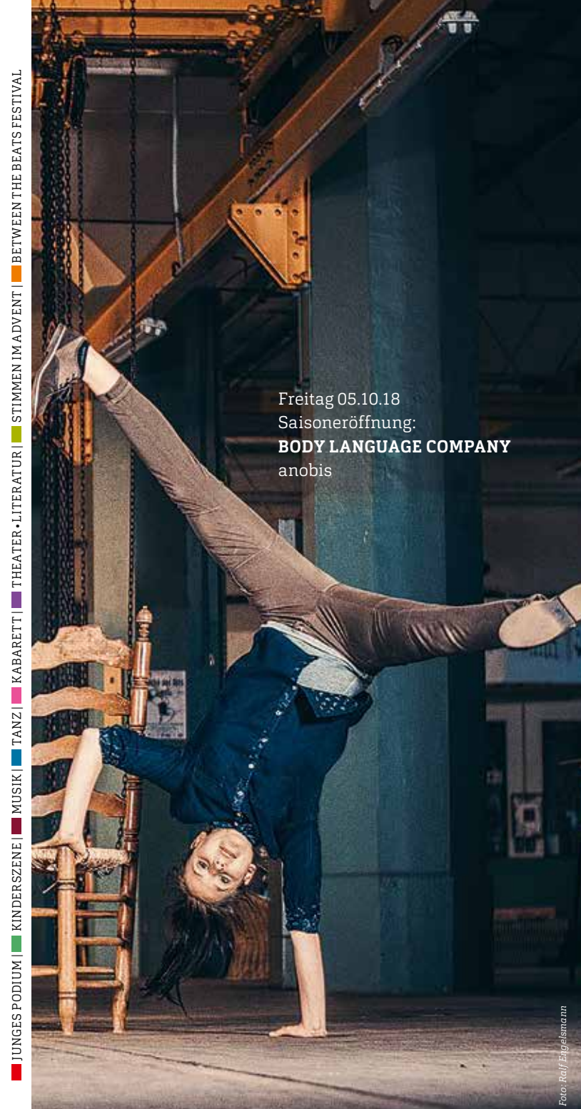
Freitag 05.10.18 Saisoneröffnung: BODY LANGUAGE COMPANY anobis